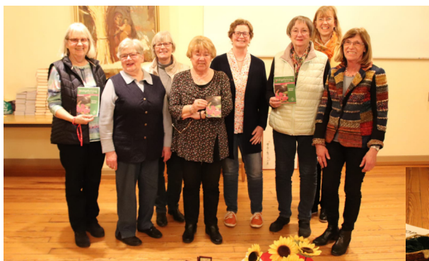
Weltgebetstag 2023 in Mußbach

Möchten Sie die weltweiten Frauenprojekte fördern, hier sind die Bankdaten: Weltgebetstag der Frauen – Deutsches Komitee e.V. Evangelische Bank EG; Kassel IBAN: DE 42 5206 0410 0404 0045 40.